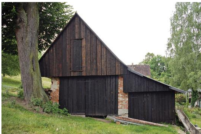
Dolní část dřevníku čistý tér, horní část tér se Iněným olejem

Na dřevěné konstrukce a masivní dřevostavby jako jsou roubenky a sruby, ale i na přístěnky, terasy apod. se výborně hodí směs těchto tří přírodních produktů. Například ve Skandinávii používají tuto směs již mnoho set let na jejich tradiční sloupové kostely, z nichž některé jsou staré až tisíc let. Taktéž norské lodě byly od nepaměti natírány právě touto trojicí.